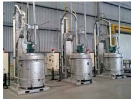
\ Estación de precalentamiento de cucharas

Etzerre Kaminoa 21 \ 48970 Basauri \ Bizkaia \ Spain