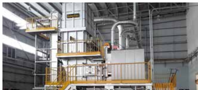
\ Horno MELTOWER® estático