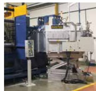
\ DMAE dosificador