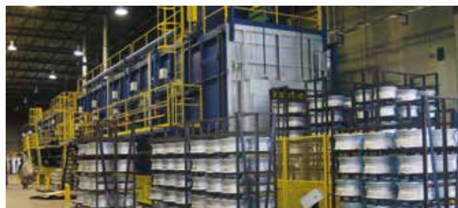
\ T6 en solera de rodillos para llantas en continuo