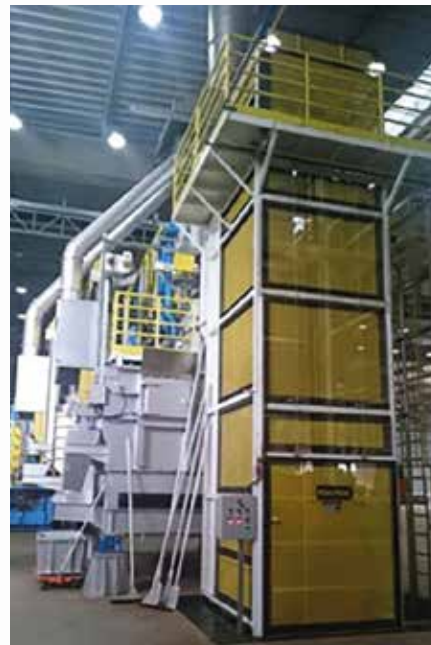
\ Elevador volteador de cestones