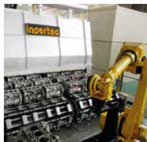
\ T5 con cadena, para bloque motor