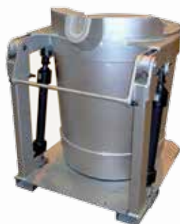
\ Cucharas basculantes