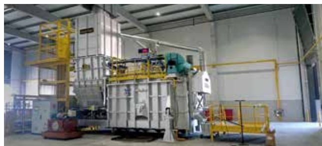
\ Horno MELTOWER® basculante