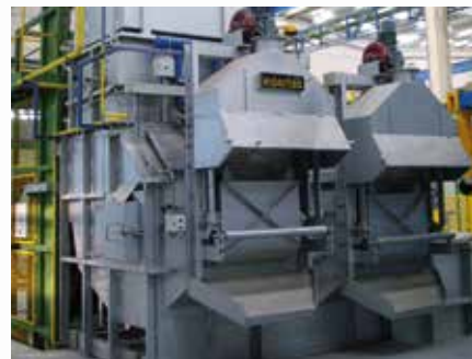
\ MELHOLDER® In-Line