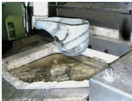
\ Cazo en pozo de colada con filtro cerámico