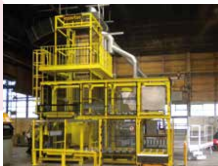
\ Acumulador de cestones