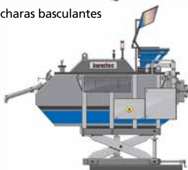
\ DMAE Horno dosificador