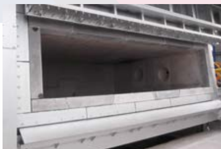
\ Pieza prefabricada en marco de puerta