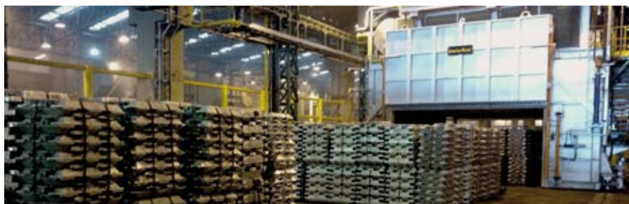
\ Secador lingotes