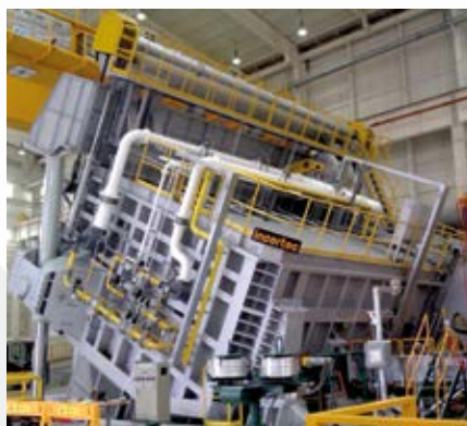
\ Horno mantenedor basculante