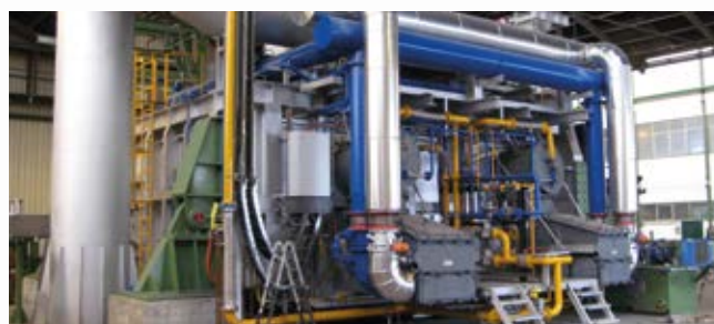
\ Quemadores regenerativos