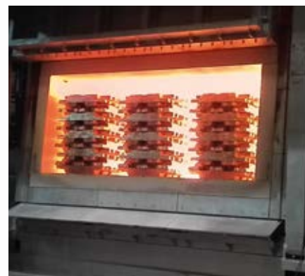
\ Horno reverbero solera seca