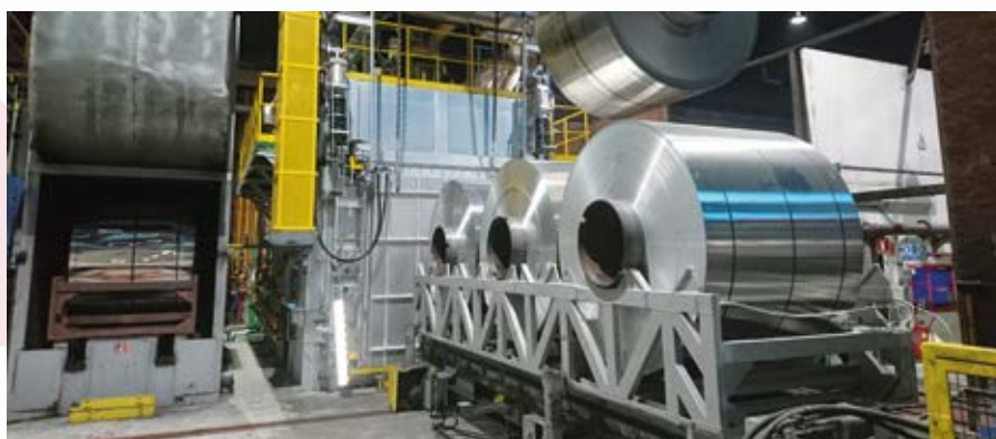
\ Horno recocido bobinas