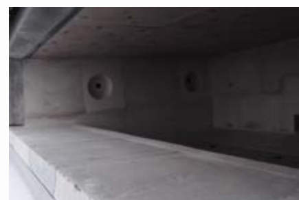
\ Pieza prefabricada en solera seca