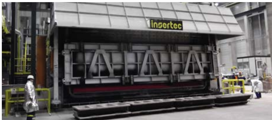
\ Horno reverbero basculante